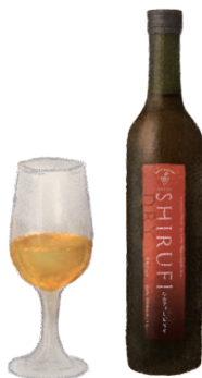
シルフィードライ【辛口】

辛口白ワインにブランデー原酒を加え加熱 熟成。樽熟成による香ばしさとドライな 味わいは食前酒にぴったり。