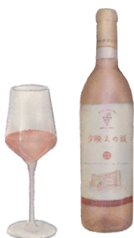
夕映えの城 ロゼ【中甘口】