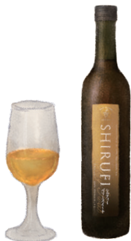
シルフィーベリースweet【甘口】

白ワインにブランデー原酒を加え加熱熟成。 樽熟成による香ばしさとマイルドさに 芳醇な甘さが溶け込んだワイン。