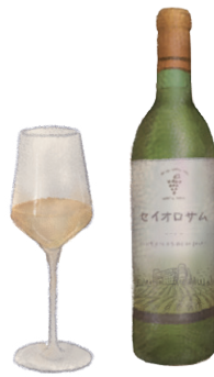
セイオロサム 白【辛口】