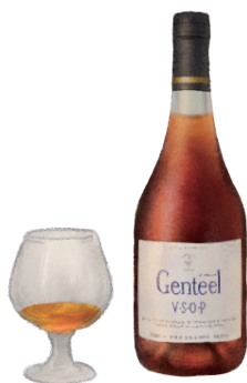
ジェンティールV・S・O・P

十勝のブランデーづくりは1964年から。10年以上熟成させた原酒を使用した繊細でマイルドな味わい。