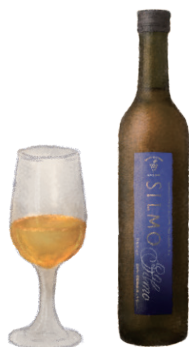
シルモ【濃厚な甘口】

発酵途中の白ワインにブランデー原酒を 加え10年以上熟成。北国特有の力強い 酸味が濃厚な甘みを引き立てます。