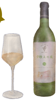
夕映えの城 白【やや甘口】