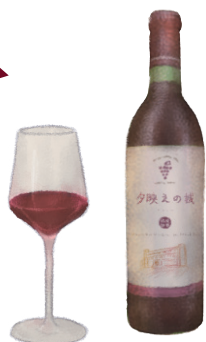
夕映えの城 赤【中口】

軽やかな飲み口、優しい酸味に包まれ飲み飽 きないワイン。どんな料理にも合わせやすい。