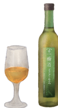
梅酒 ~ブランデー仕込み~

北海道産の梅をブランデー原酒に漬け込み熟成。 ブランデーと青梅の軽やかなハーモニーと深い コクを感じる唯一無二な樽熟成梅酒。